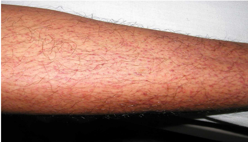
図 1. デング熱患者の発疹：解熱時期にみられた点状出血